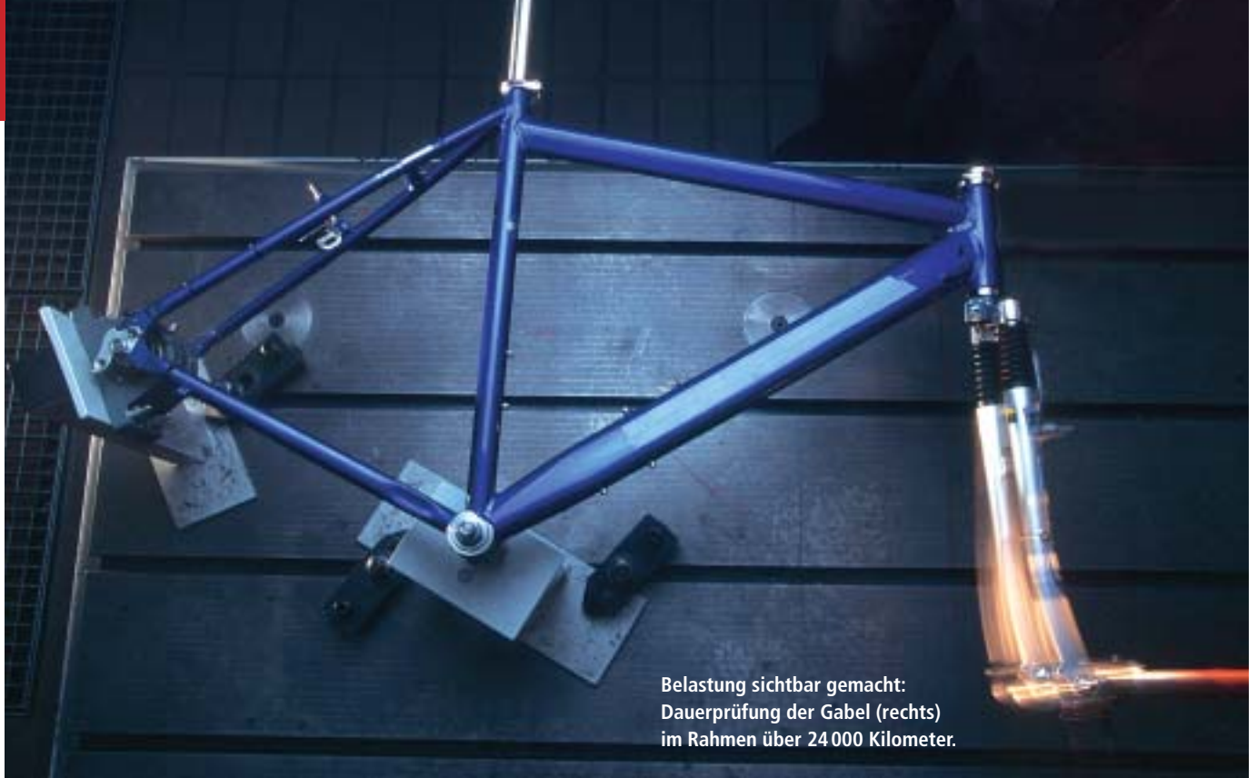
Belastung sichtbar gemacht: Dauerprüfung der Gabel (rechts) im Rahmen über 24 000 Kilometer.