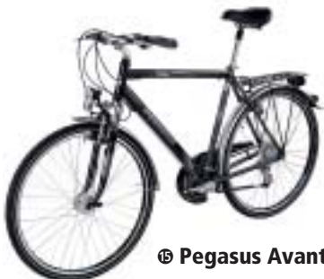
Ⓢ Pegasus Avanti