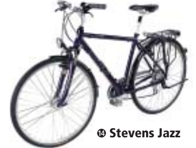
⑱ Stevens Jazz