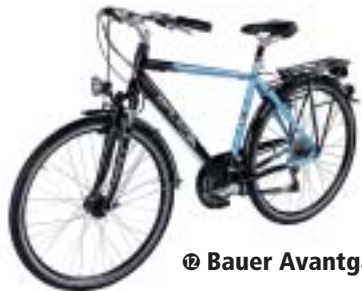
⑯ Bauer Avantgarde