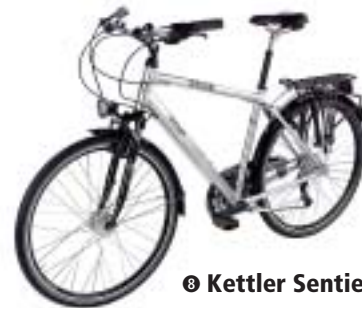
⑬ Kettler Sentiero