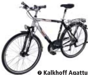
Ⓢ Kalkhoff Agattu

Geprüft im Epple Cross Cat (700 Euro). Die Tester bemängelten die nicht optimale Übersetzung beim Bergauffahren. Unter Last ließen sich die Gänge nur schwer wechseln. Die Abstufung der neun Gänge ist gleichmäßig und wurde im Schnitt eine Note besser beurteilt als die Nexus Acht-Gang-Nabe. Als störend wurden die Lauf- und Schaltgeräusche der Nabe bewertet, die vor allem im sechsten und neunten Gang vernehmlich surrte. Eine gute Anleitung ist vorhanden. Die Verzögerung der Rücktrittbremse ist nass wie trocken gut.