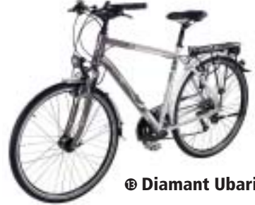
⑰ Diamant Ubari