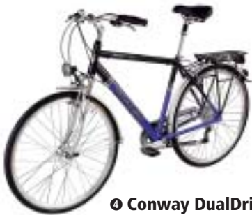
⑩ Conway DualDrive