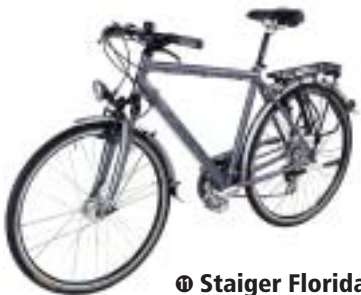
Ⓢ Staiger Florida