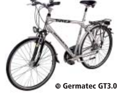
⑮ Germatec GT3.0