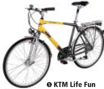
⑪ KTM Life Fun