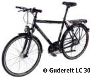
⑭ Gudereit LC 30